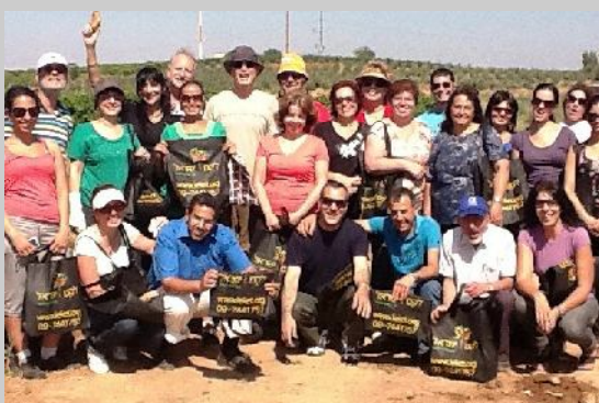
עובדי קבוצת לאומי במהלך התנדבות בארגון לקט ישראל

להפעיל תוכניות התנדבות רבות משתתפים. בכל שנה יוצאים מאות מעובדי הקבוצה לשדות החקלאיים של לקט ישראל וקוטפים פירות וירקות טריים המועברים ע"י צי משאיות לקט ישראל ישירות לעמותות לנזקקים. בשנה האחרונה נקטפו על ידם כ-40 טון (40,000 ק"ג) פירות וירקות טריים אשר הועברו מיידית לתזונתם של כ-80,000 נזקקים.