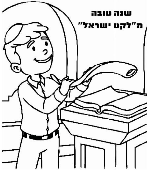
שנה טובה מ"לקט ישראל"