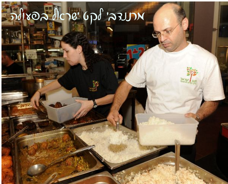
מתנדבי לקט ישראל בסניף

כל שצליכס לעשות עם אמת להצטרף למאגף הנתינה הוא ל'צור קשר - 09-744-1757, nirh@leket.org